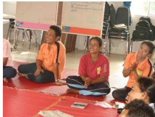
ส.อบต.สำลี แห่งบ้านทำนบ

หลังจากเวลาเคลื่อนผ่านไปจากวันที่จัดค่ายเสริมศักยภาพเยาวชนผ่านมารวม 2 เดือน ผู้เขียนเองทั้งเคยเข้าไปร่วมกิจกรรมและได้รับรู้เรื่องราวดีๆ จากพี่น้องกันตวจะมวด เมื่อเข้าไปในพื้นที่อีกครั้ง